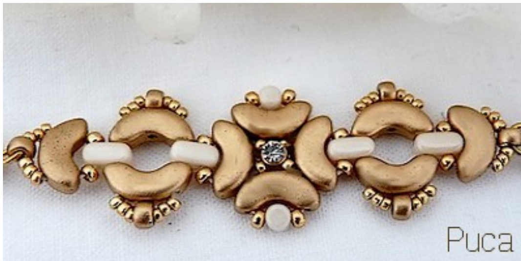
Schéma Élément « Mina »